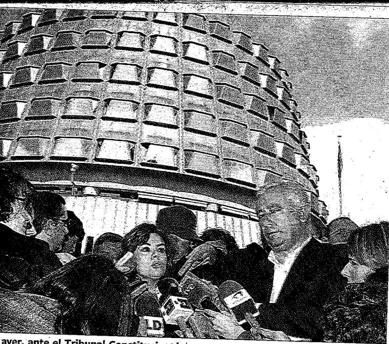
ayer, ante el Tribunal Constitucional.