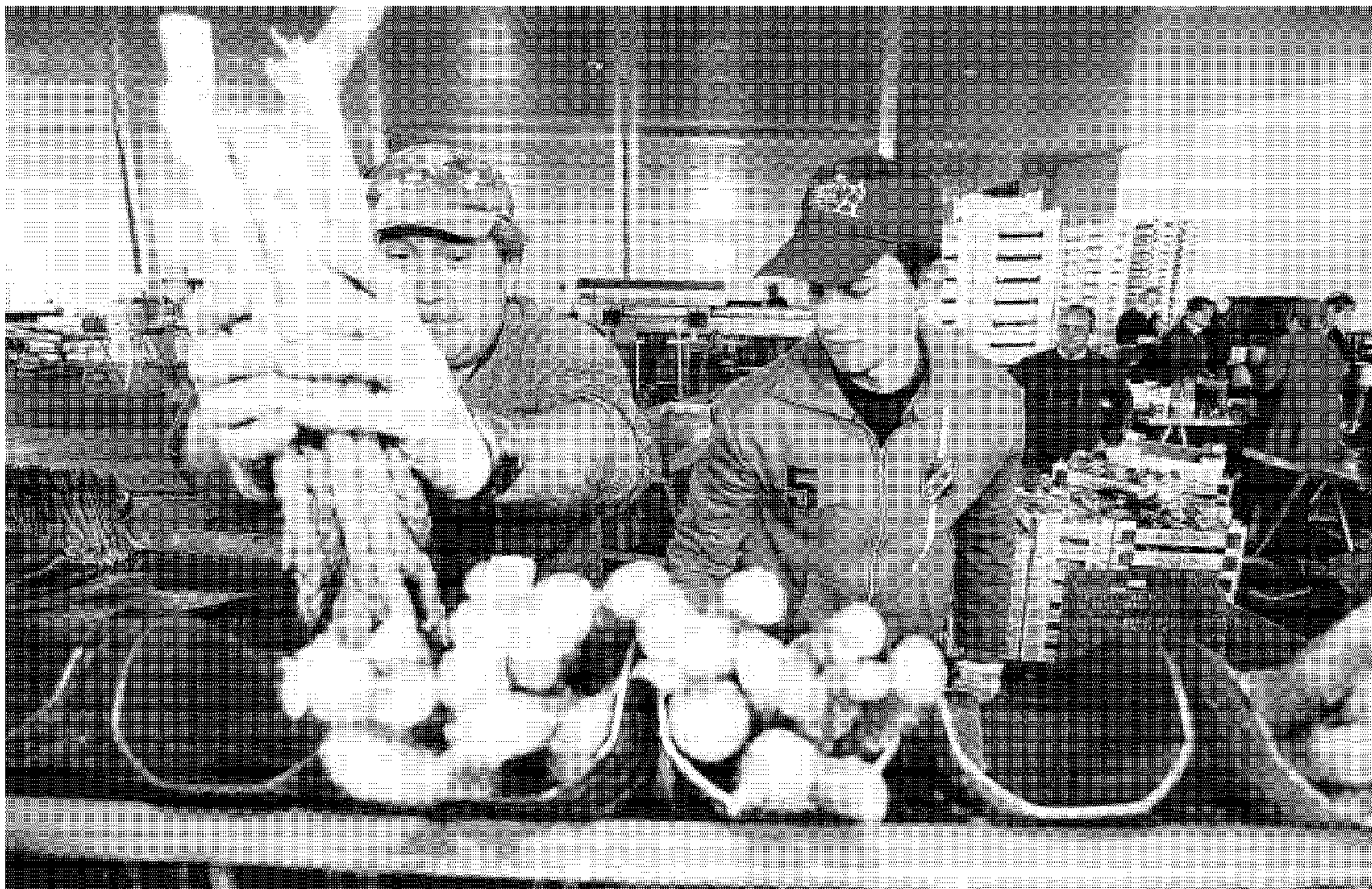
Las cooperativas y sociedades laborales del sector primario dan trabajo a más de un millar de granadinos.

Desde enero de 2008, un total de 160 cooperativas y sociedades laborales se han visto obligadas a cesar su actividad. Las 906 empresas de la economía social que existen actualmente en la provincia —los datos facilitados por Cepes se refieren al primer trimestre del año— arrojan un descenso del 12,8% respecto a las sociedades activas en marzo de 2008, que al-