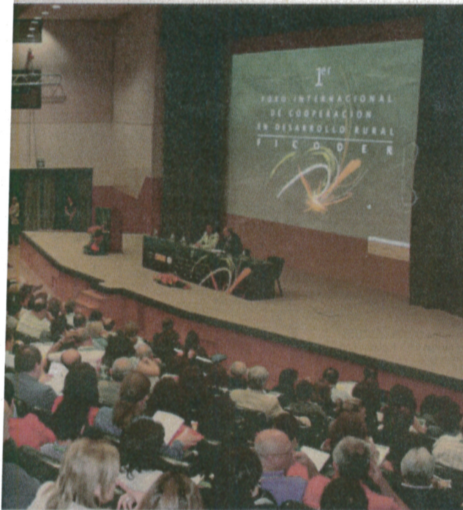
o 8 de junio

calidad de vida de territorios rurales, a los que indicó que ya tienen abierta la ventanilla para la presentación de los proyectos en las sedes de los Grupos de Desarrollo Rural.