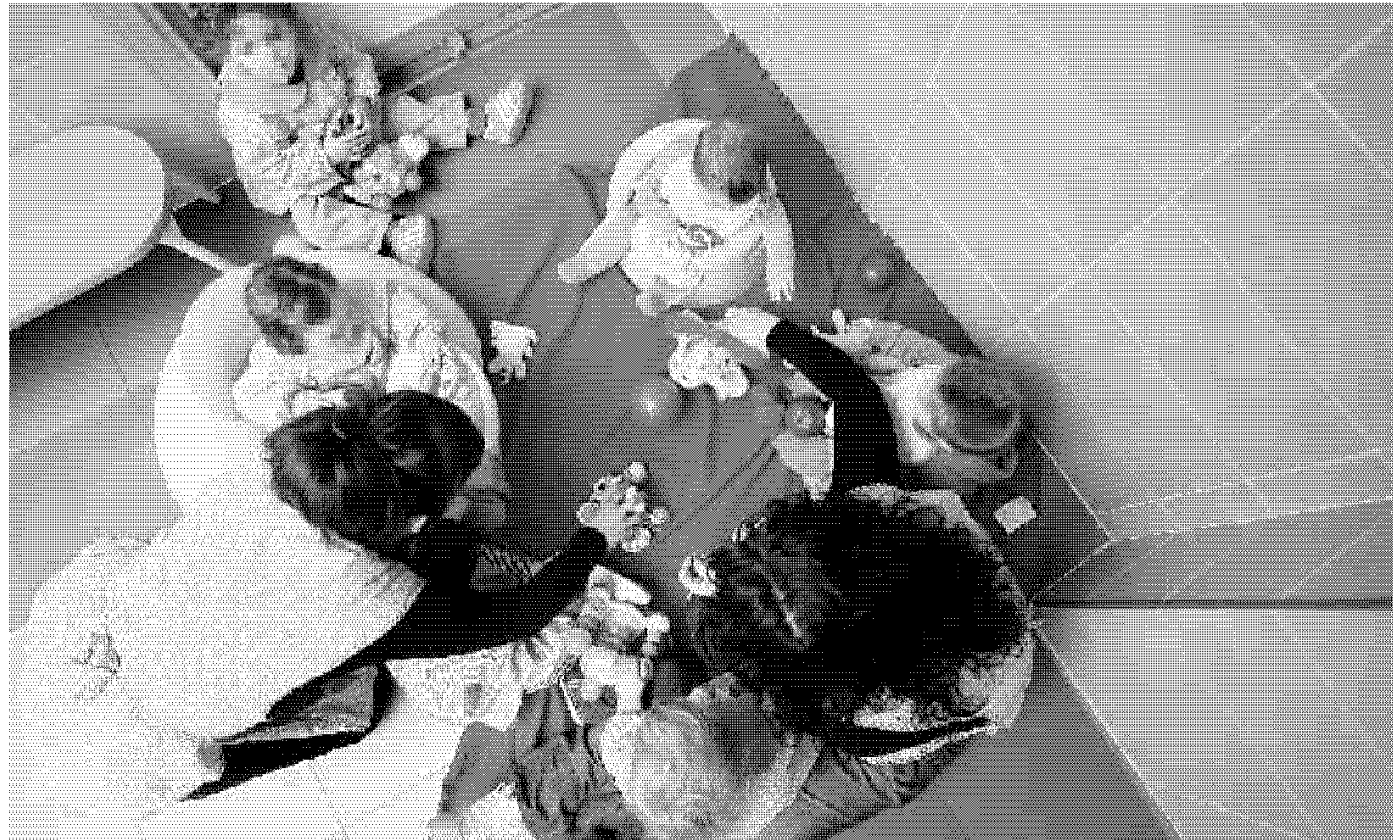
ATENCIÓN. Dos profesoras están pendientes de los pequeños en la guardería gaditana.

Rescatan a 21 inmigrantes y un bebé en una patera a cuatro kilómetros de Tarifa