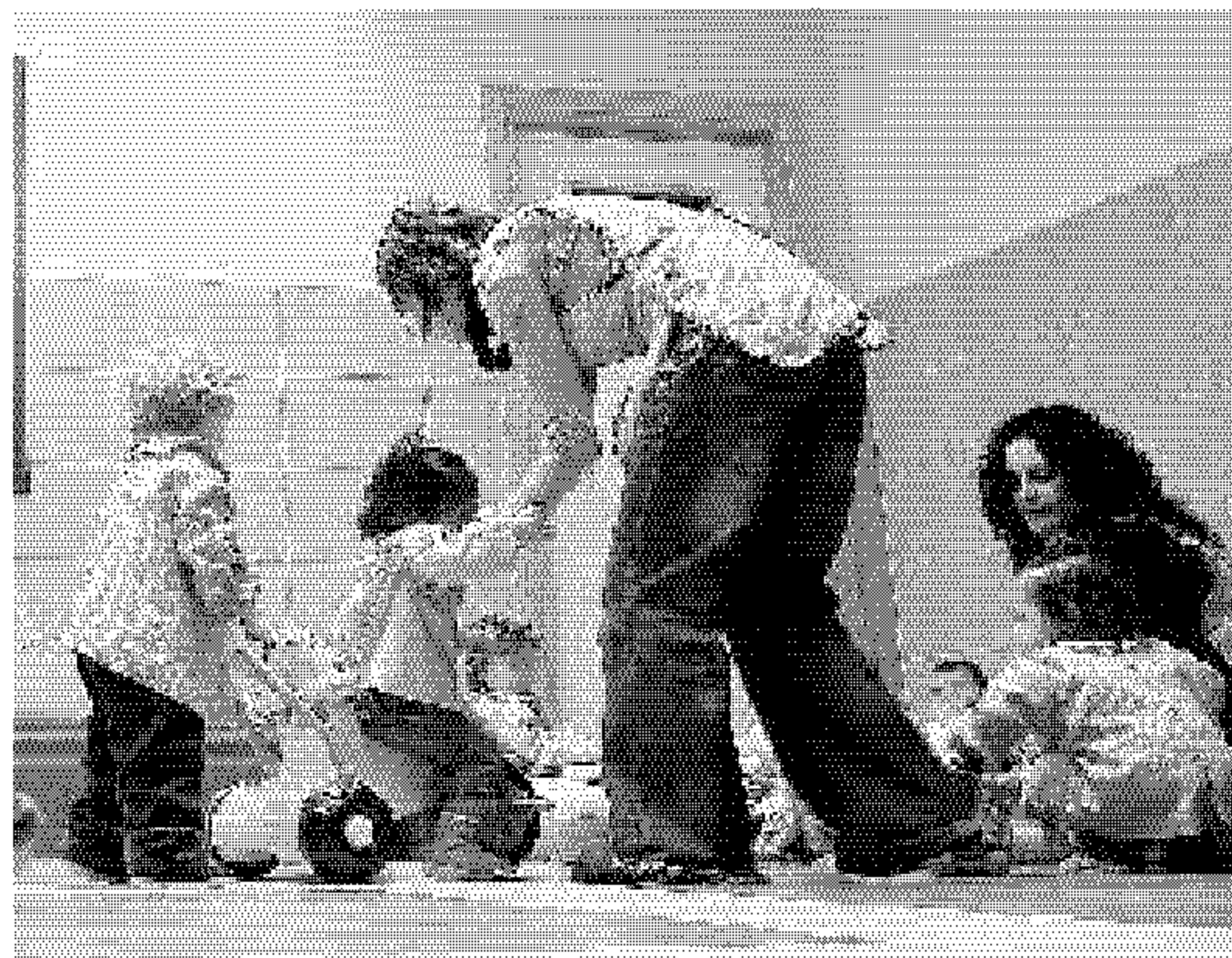
DEDICACIÓN. Los alumnos tienen todo tipo de juguetes.

Hasta cinco años tardaron en encontrar el local apropiado, porque estaba claro que tenía que ser en el centro de la ciudad, donde menos oferta hay. Y lo encontraron justo al lado de la Cate-